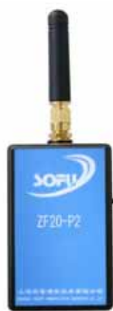
内置电池接收终端